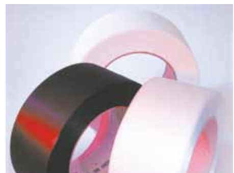
Bedruckte und spezielle Bänder