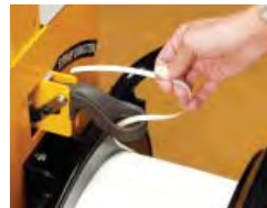
Sostituzione facile e veloce della bobina