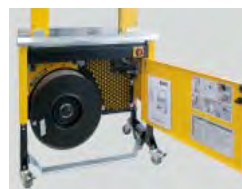
Costruzione robusta e compatta