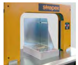
Taquage pour aligner des paquets lâches