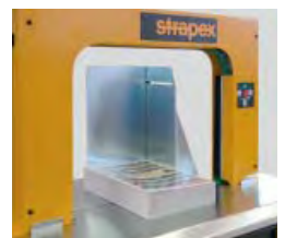
Pakkeanslag til fastholdelse af løse produkter